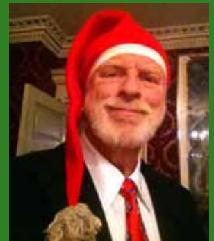
Formandens klumme - side 4