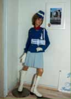
Man bliver naturligvis budt velkommen af en garder når man træder ind ad Tøjhushavevej 3B