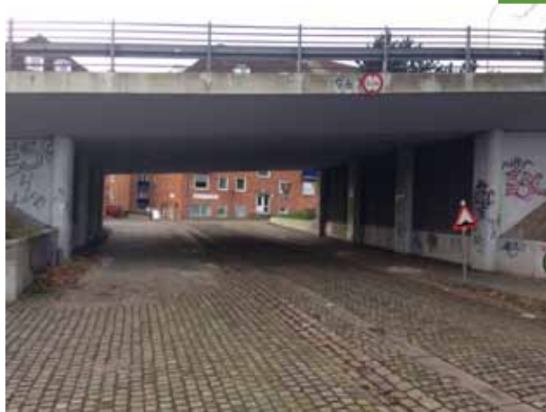
Som den ser ud nu. Foto: formanden, som får tankerne tilbage til Øst-tyskland i 60'erne