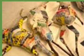
For børn på Gaia