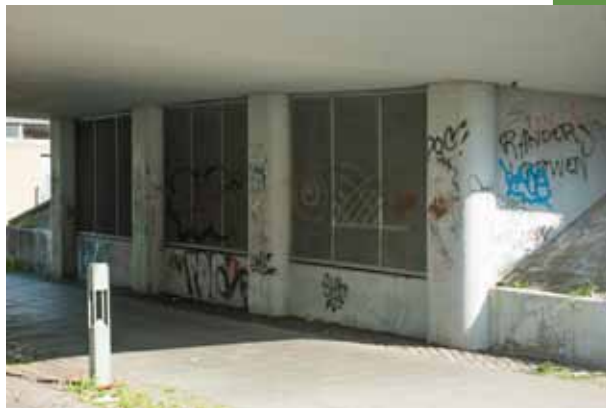
Som "porten" henlå efter udskiftning af lamper.