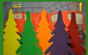
Aktiviteter i kvarteret - side 7