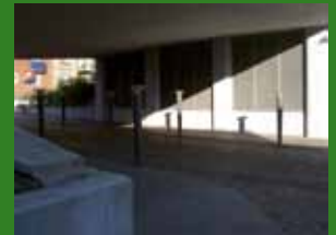
Fra idé til fallit - side 3