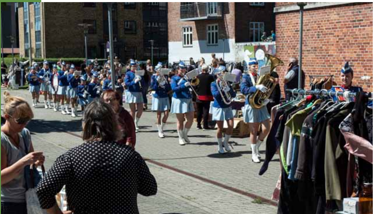
Fra Randers Pigegardes ankomst til sommerens loppemarked

Besøg deres hjemmeside randerspigegarde.dk