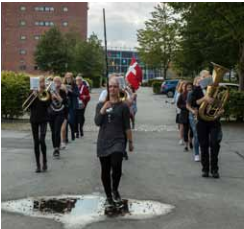
Eksercits på pladsen foran Gaia