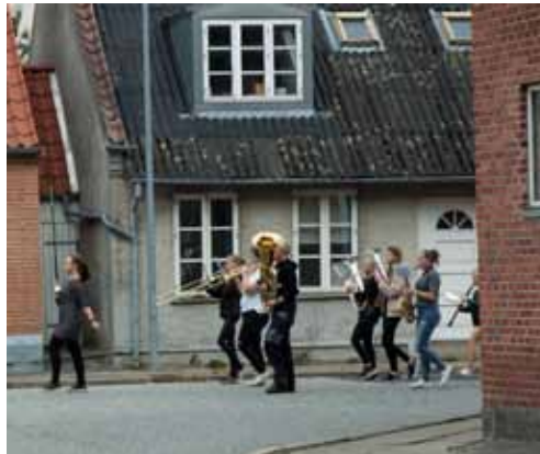
Marchtræning i Lorentzgade

der kommer en pige ind fra gaden, som har lyst til at være med, fordi hun gerne vil lære at spille og måske lidt, fordi uniformerne er så flotte.