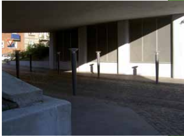
Som den så ud umiddelbart efter færdiggørelsen.

Vi har rettet henvendelse og foreslået et møde om "portens" fremtid. Det kommer til at foregår i begyndelsen af januar. Red.