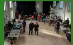
Julemarkedet - side 5